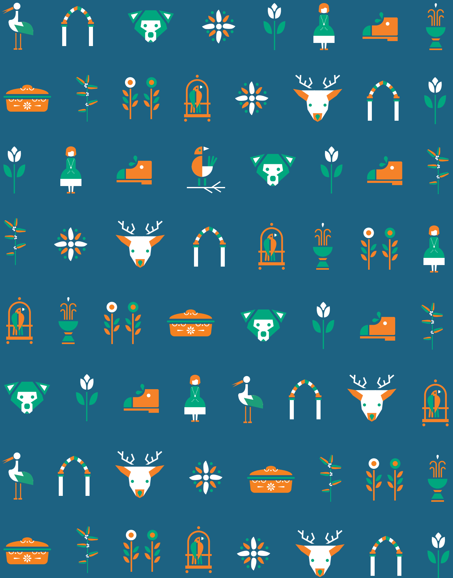
Charte graphique : collectif ÇA VA 2 PAIRE